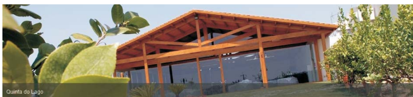
Quinta do Lago

Partida às 8 horas da Av. Defensores Chaves, 4C (frente à Sede da Delegação de Lisboa) em direção à A1, breve paragem na Área de serviço de Santarém, Barragem de Castelo do Bode (visita), Alferrarede - Quinta do Lago (almoço). Em hora a combinar localmente regresso a Lisboa.