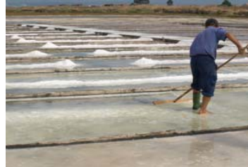
“Quanto do teu sal...”