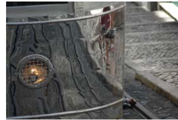
“Entre montes e vales”