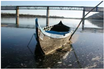
“O que fazer com este barco?”