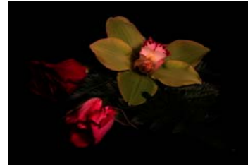
“(natureza-morta) Repintada ”