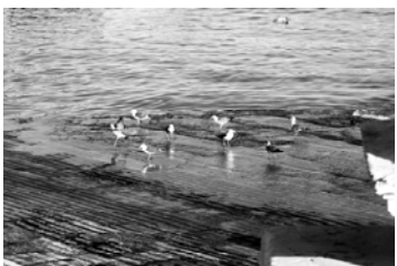
“O Cais revisitado”